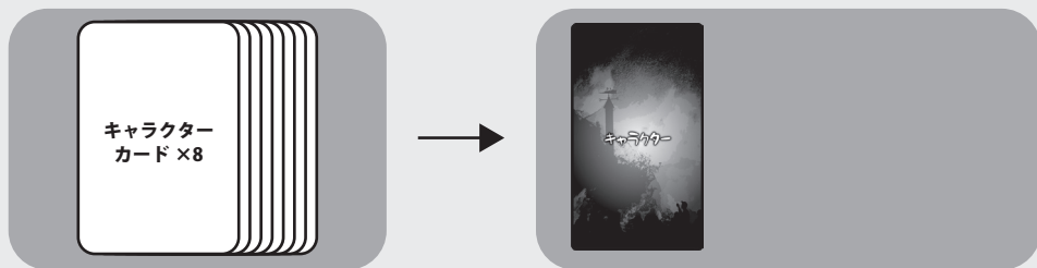
ゲームボード上に右図のように配置されます

8枚のキャラクターカードからランダムに1枚抜き出し、それをゲームボードのキャラクター(非公開)置き場に配置します。カードを抜き出す時、誰もそのカードを見てはいけません。このカードはそのラウンド中使いません。